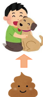
噛まれたり、フン尿などが口から入っ たりすることで感染します。