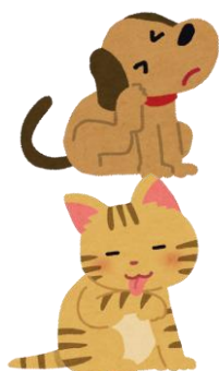
ワンちゃんや猫ちゃんが これらを持っています。