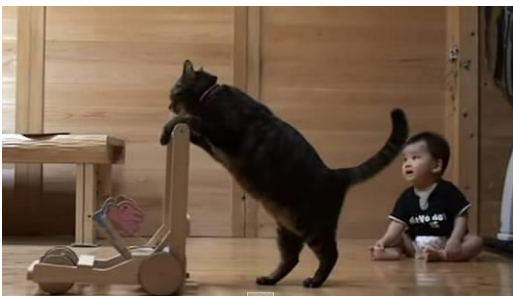
ネコ「こうやって歩くんだよ」