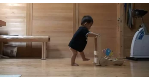
赤ちゃん「こうかな？」