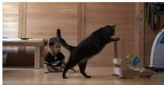
ネコ「違う、違う。 こうだよ」