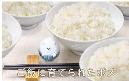
ご飯に育てられたポメ