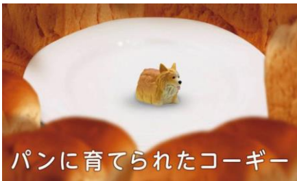
パンに育てられたコーギー

カプセルトイメーカーの株式会社 Qualia より 6 月に発売されるカプセルトイ「食べものに育てられた犬」シリーズが、最強可愛いのでみんな見て！ パンに育てられたコーギー ご飯に育てられたポメ 他 5 種 最高にシュールなガチャガチャが出ます。