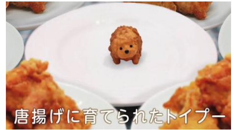
唐揚げに育てられたトイプードル