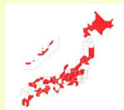
SFTSウイルスを保有したマダニの生息地域（2016年3月時点）

フィラリア、ノミダニの予防期間に関しては、地域によって違ってきます。詳しくは獣医さんに確認してみてください。