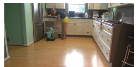
飼い主様にこんにちは～